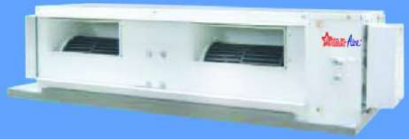
Model : DHDF-45 - DHDF-60