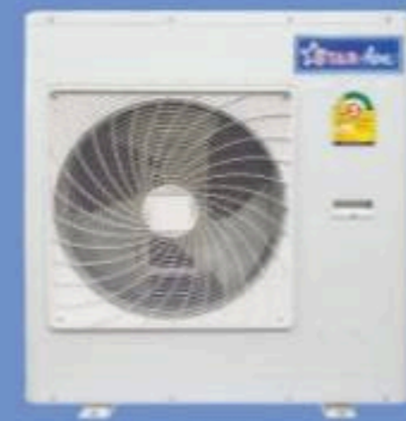
Model CR-455-3 - CR-605-3