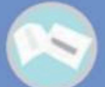
ระบบแผ่นฟอกอากาศ