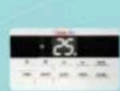
รีโมทคอนโทรล มาตรฐาน Digital (Standard)

ฉลากประหยัดไฟเบอร์ 5 ได้รับการรับรองจากกรมไฟฟ้าฝ่ายผลิตแห่งประเทศไทย