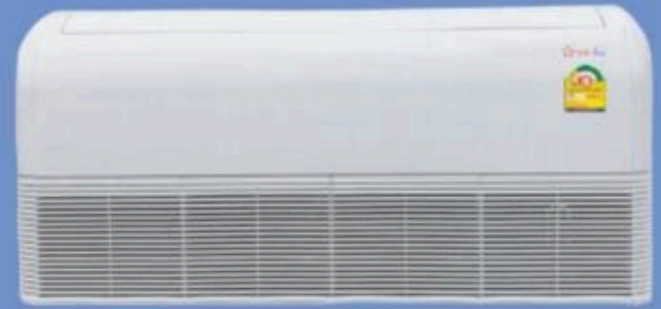
Model : DCR5-1500 - 2000