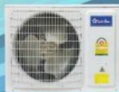
Model CM-125A - CM-255A