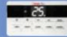
รีโมทคอนโทรล มีสายแบบ Digital (Standard)