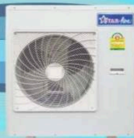
Model CR-365-A - CR-405