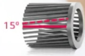
15° Tilted Stabilizer Skew Fan