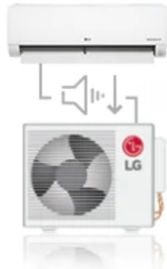
Quieter Refrigerant Transfer DUAL Inverter Compressor™