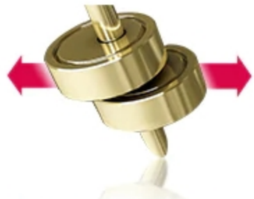
40% Cut Torque Variation DUAL Inverter Compressor™