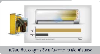
เปรียบเทียบอายุการใช้งานในสภาวะแวดล้อมที่รุนแรง

แผงคอยล์เย็นและคอยล์ร้อนแบบ Golden Fin มีประสิทธิภาพในการระบายความเย็นและความร้อนได้ดี ทำให้เพิ่มประสิทธิภาพการไหลเวียนของสารทำความเย็น มีคุณสมบัติช่วยยืดอายุการใช้งานเครื่องปรับอากาศ สามารถทนต่อฝนกรด ช่วยป้องกันการกัดกร่อนของไอเค็มบริเวณชายทะเล และสารเคมีที่มีฤทธิ์กัดกร่อนอื่นๆ ในย่านโรงงานอุตสาหกรรมได้มากยิ่งขึ้น