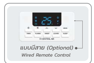
แบบมีสาย (Optional) Wired Remote Control