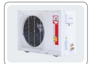
CONDENSING MODEL : CCS-32BF