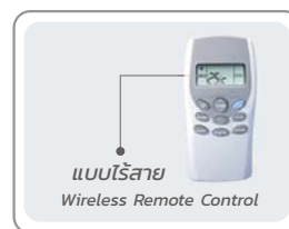
แบบไร้สาย Wireless Remote Control